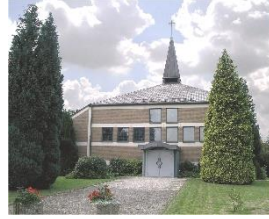
St. Elisabeth Nordbögge Liegnitzer Straße 1, 59199 Bönen